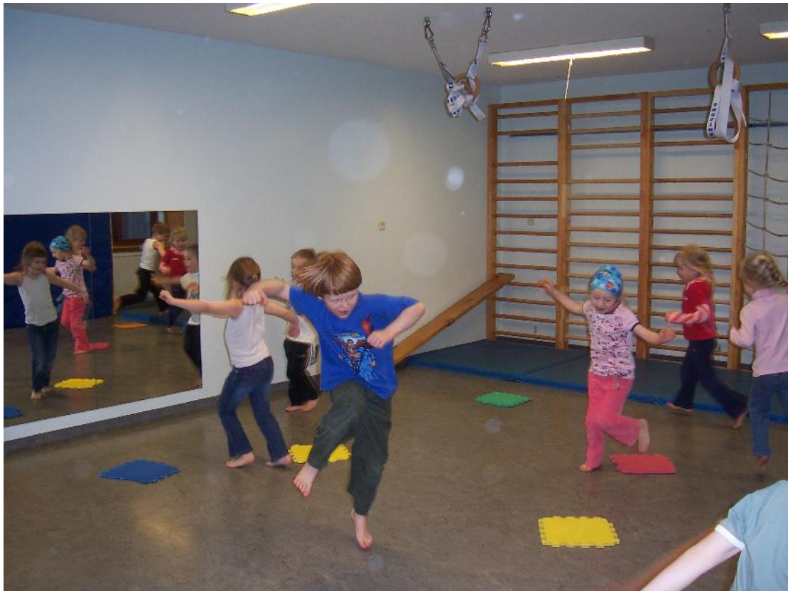
Hreyfistund í sal